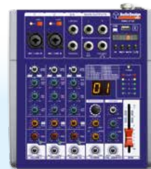
PAMX1.211SC 2 Canali mono