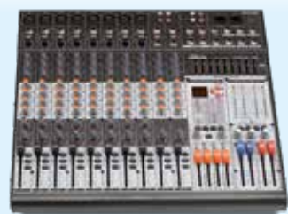
PAMX3.82 6+2 Canali mono