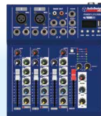
PAMX1.21USB2 2 Canali mono