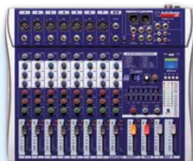
PAMX2.711 7 Canali mono