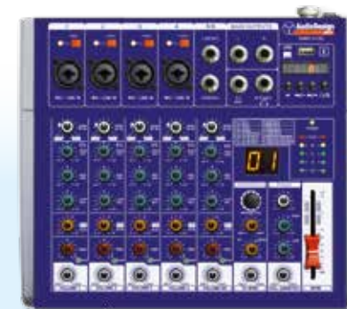
PAMX1.411SC 4 Canali mono