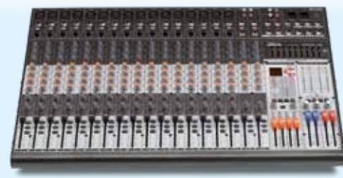
PAMX3.162 14+2 Canali mono