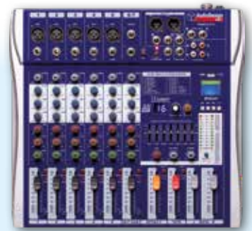
PAMX2.511 5 Canali mono