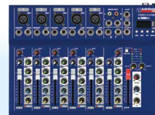
PAMX1.51USB2 5 Canali mono