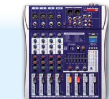
PAMX2.311 3 Canali mono