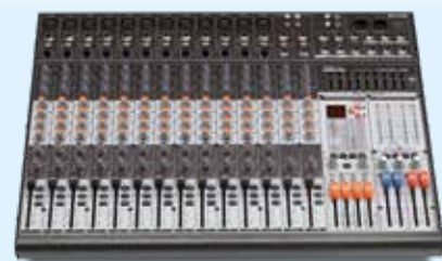
PAMX3.122 10+2 Canali mono